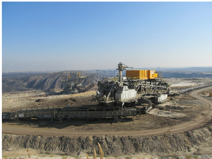
BRD-Propaganda für Januar 2020: 8,5 GW Kernkraft sind kein Ersatz für 45 GW Kohlestrom [1]

Die Erzeugungskosten für Steinkohle sind höher. Sie liegen bei fünf Ct/kWh. Der höhere Energiegehalt der Steinkohle erlaubt aber den Landtransport mit Kohlezügen oder Binnenschiffen zum Verbraucher. Stromtrassen und Leitungsverluste durch lange Leitungen fallen dadurch weg.